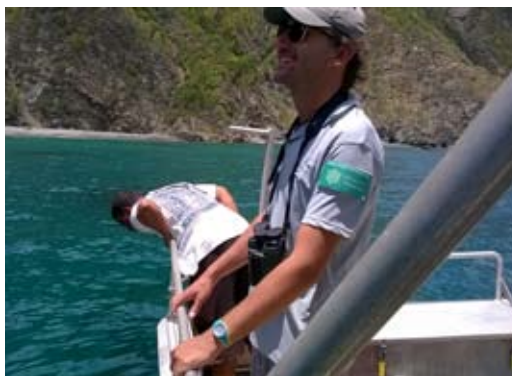
Heureusement qu'il y a des volontaires pour nourrir les poissons...