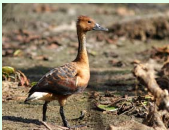
Dendrocygne fauve - A. LEVESQUE