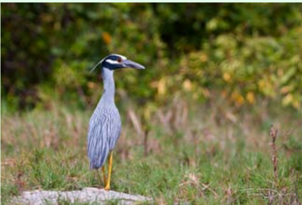
Bihoreau violacé - F. DELCROIX