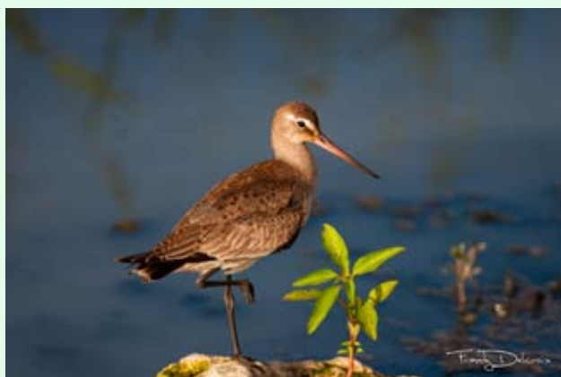
Barge hudsonienne aux Abymes - F. DELCROIX