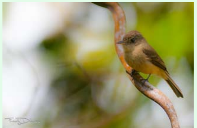
Moucherolle gobemouche - F. DELCROIX