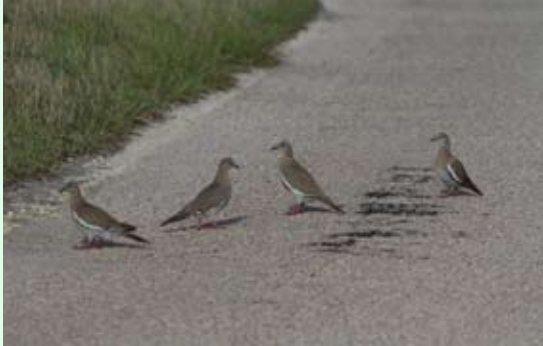
Tourterelles à ailes blanches - A. LEVESQUE