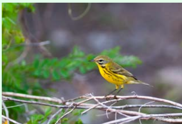
Paruline des prés (1 ère donnée pour la Désirade) F. DELCROIX