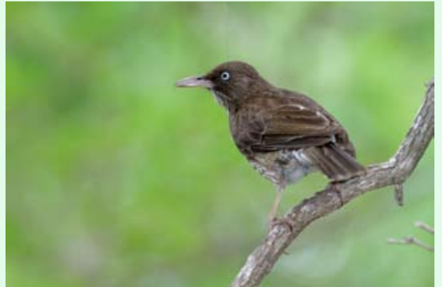
Moqueur corossol - A. LEVESQUE