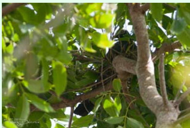
Pigeon à couronne blanche sur son nid