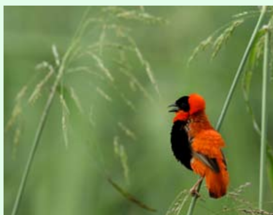
Une touche de couleur ! Euplecte franciscain - A. LEVESQUE