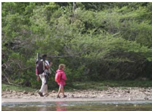
Mère et fille explorant la Grande Saline de la PDC...

L'Albatros à nez jaune Thalassarche chlororhynchos le 30 mai 2016 (nouvelle espèce pour la Guadeloupe et pour la Caraïbe).