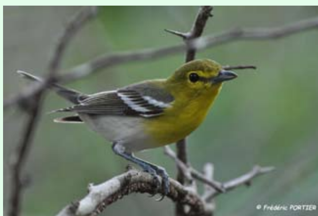
Viréo à poitrine jaune - F. PORTIER