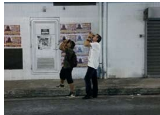
Comptage des Hirondelles à ventre blanc à Pointe-à-Pitre avec le stagiaire.