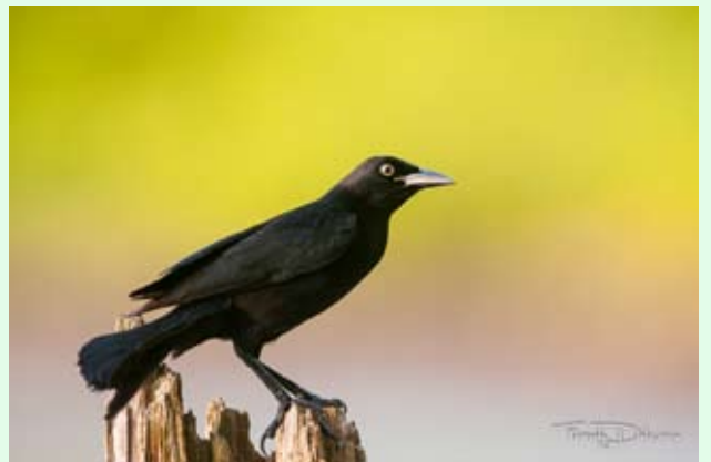
Quiscale merle