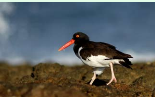
Huîtrier d'Amérique - A. LEVESQUE