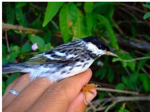
Paruline rayée capturée le 24/04/07 à la Pointe des Châteaux – rare en migration prénuptiale. Photo A. Levesque.

Le suivi des effectifs d'Hirondelles à ventre blanc Progne dominicensis à Pointe à Pitre, montre que l'espèce est absente pendant environ 3 mois de l'année. Le pic de stationnement a lieu à la mi septembre. Le « trou » observé mi août est la conséquence du passage du cyclone Dean la veille du comptage.