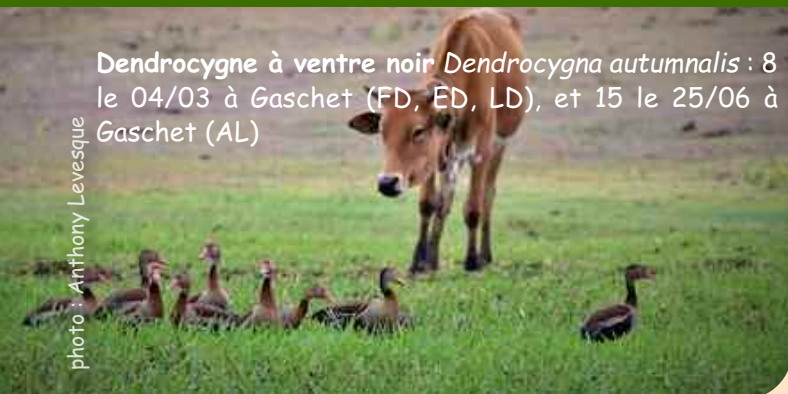
Dendrocygne à ventre noir Dendrocygna autumnalis : 8 le 04/03 à Gaschet (FD, ED, LD), et 15 le 25/06 à Gaschet (AL)