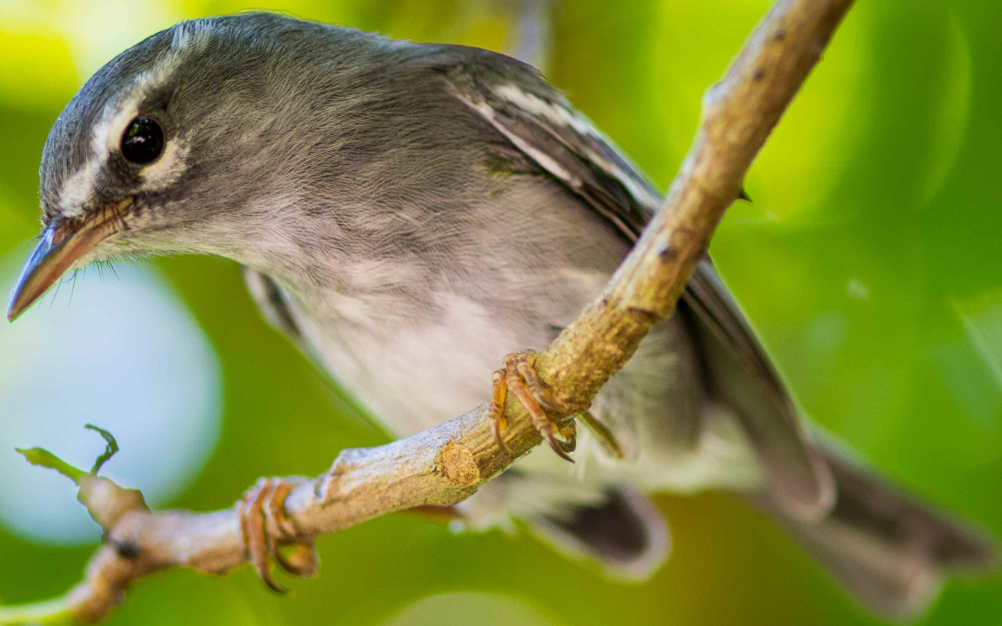
Paruline caféïette Setophaga plumbea