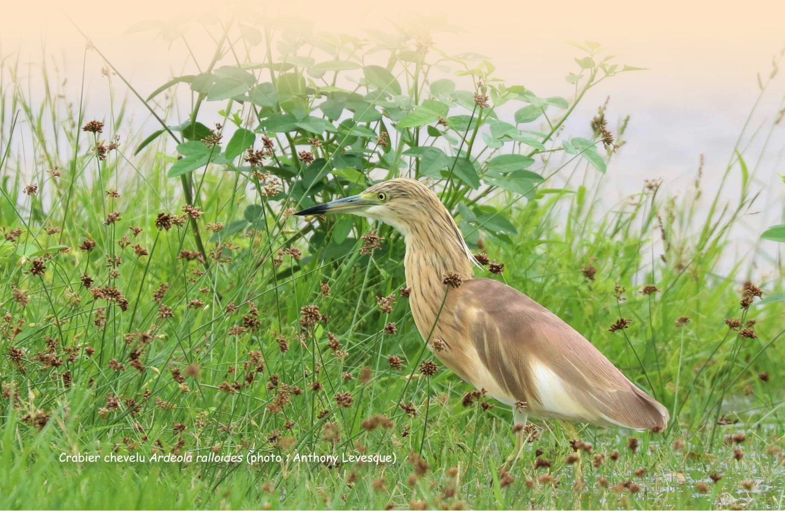
Crabier chevelu Ardeola ralloides

Cette synthèse complète le rapport d'activités de l'année 2018 (rapport AMAZONA n°60) en ligne sur le site d'AMAZONA : www.amazona-guadeloupe.com