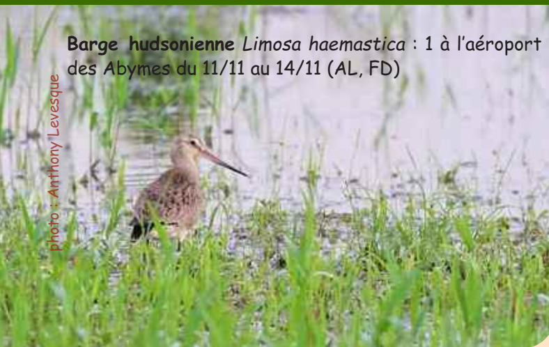
Barge hudsonienne Limosa haemastica : 1 à l'aéroport des Abymes du 11/11 au 14/11 (AL, FD)