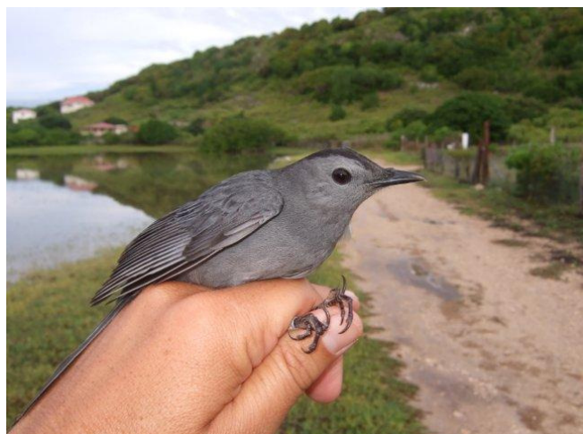
Moqueur chat Dumetella carolinensis (A. Levesque)