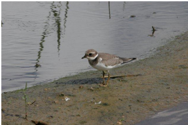
Grand Gravelot Charadrius hiaticula (A. Levesque)

Les espèces sont classées ici selon la systématique proposée par Clements (2007).