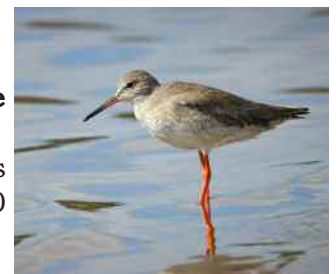
Chevalier gambette (Anthony Levesque)

Chevalier gambette Tringa totanus : 1 individu à la Pointe des Châteaux le 24/01/2020 (Jérémy Delolme)