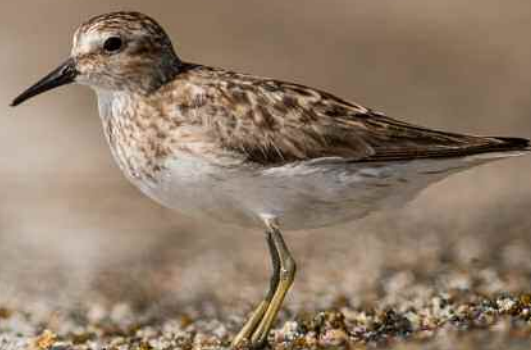
Bécasseau minuscule (Frantz Delcroix)

Le Conseil Départemental a établi un partenariat avec AMAZONA en vue d'assurer un suivi de l'avifaune présente sur le site du barrage de Gaschet, et la diffusion de la connaissance vers le grand public par le biais d'animations. Ce programme s'est déroulé sur deux ans, 2019-2020, avec un comptage mensuel effectué sur l'ensemble du plan d'eau, chaque premier mercredi de chaque mois. Un rapport final a été remis en 2021, et est téléchargeable sur le site d'AMAZONA (rapport n° 73).