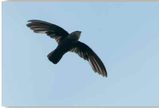
Martinet chiquesol (Frantz Delcroix)

Deux espèces de martinets nichent en Guadeloupe : le Martinet chiquesol Chaetura martinica (sédentaire) et le Martinet sombre Cypseloides niger (migrateur). Le premier vit dans les îles montagneuses des Petites Antilles : Guadeloupe, Dominique, Martinique, Sainte-Lucie, Saint-Vincent. La forme nominale C. n. niger , du second niche de Cuba à Trinidad. Elle est présente en Guadeloupe pour la reproduction de mars à octobre. Les trois autres sous-espèces sont canadiennes, américaines, et mexicaines.