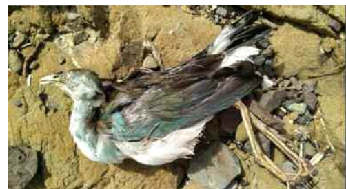
Talève violacée