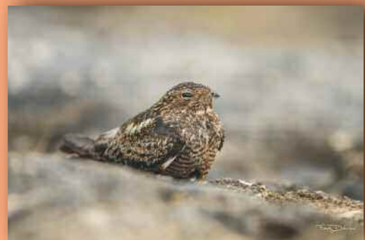
Engoulevent pyramidig (Frantz Delcroix)

Ce suivi auquel AMAZONA a participé a été financé par la DEAL et porté par LBE (Levesque Birding Enterprise). Le rapport complet est téléchargeable sur le site d'AMAZONA (rapport n° 69).