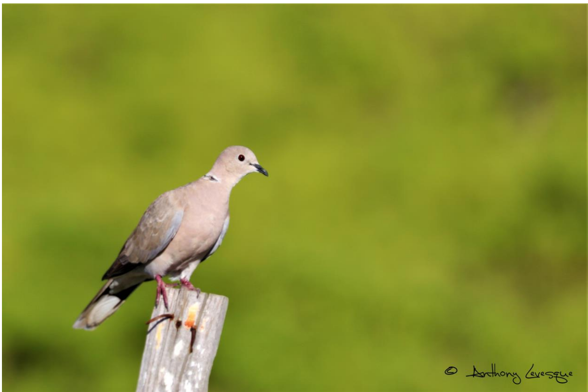
La Tourterelle turque est en augmentation spectaculaire, c'est malheureusement une espèce introduite.

La Tourterelle turque (+224,08%) est l'espèce ayant le plus augmenté. Il faudra regarder les chiffres avec précaution pour les 10 ans de suivi, car cette espèce est essentiellement urbaine, péri-urbaine et la majorité des points ne couvre pas ce type de milieux.