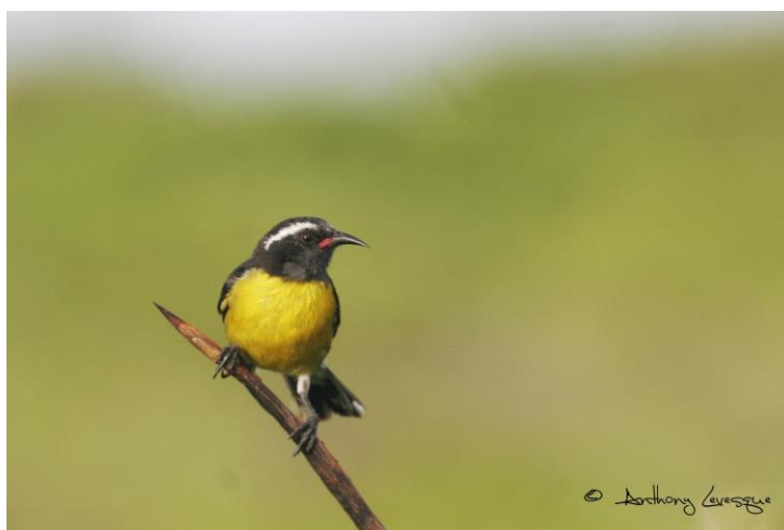
Le Sucrier à ventre jaune a chuté de 18.51 % en 9 ans.

Le Sucrier à ventre jaune est justement une des espèces ayant connu une baisse avérée de ses effectifs entre 2014 et 2022. Alexandra Villers (ingénieur à l'Office Français de la Biodiversité) a analysé les tendances de 35 espèces. Les résultats sont présentés dans le tableau 5 (page suivante).