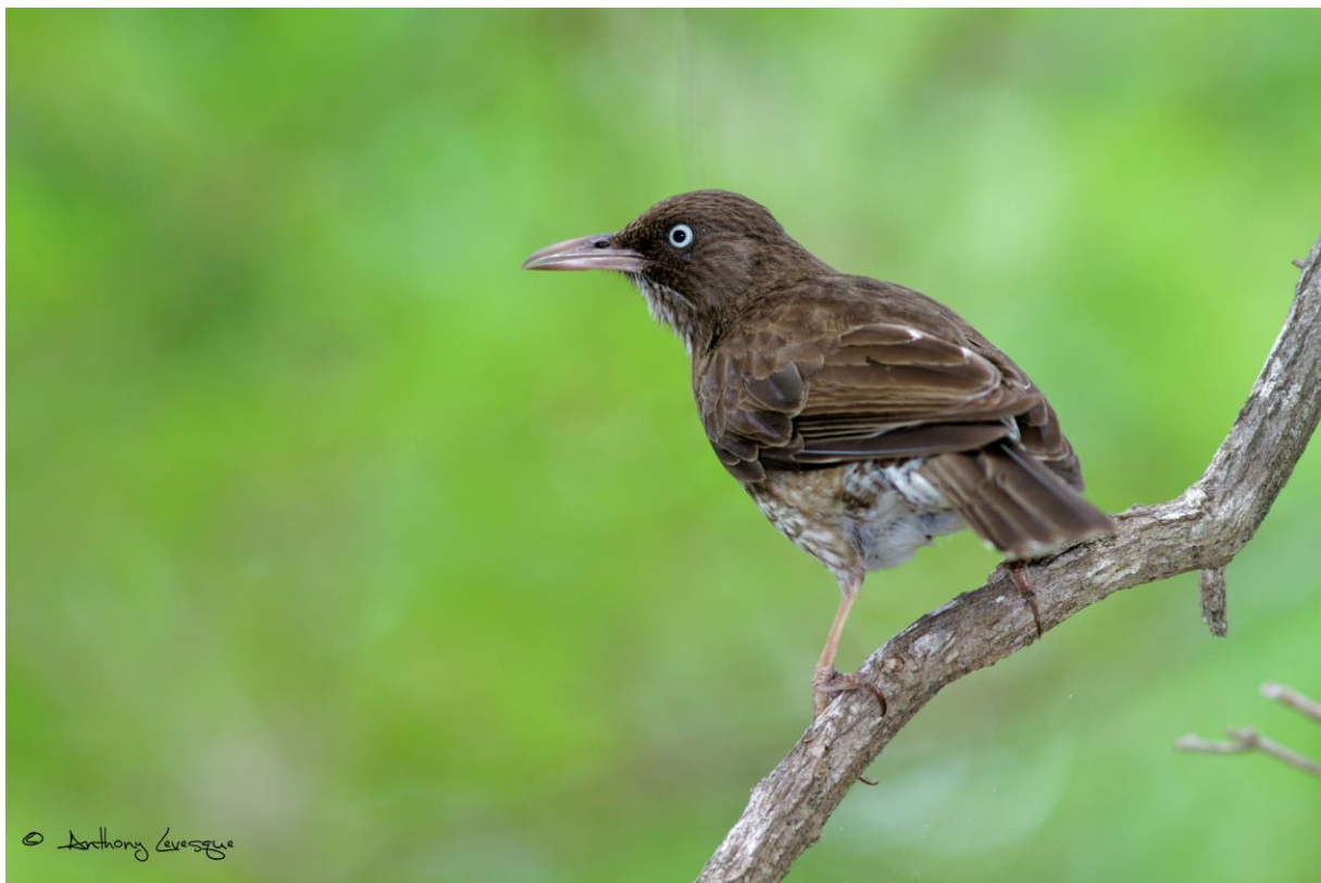
Moqueur corossol Margarops fuscatus , +42% d'augmentation de 2014 à 2022.