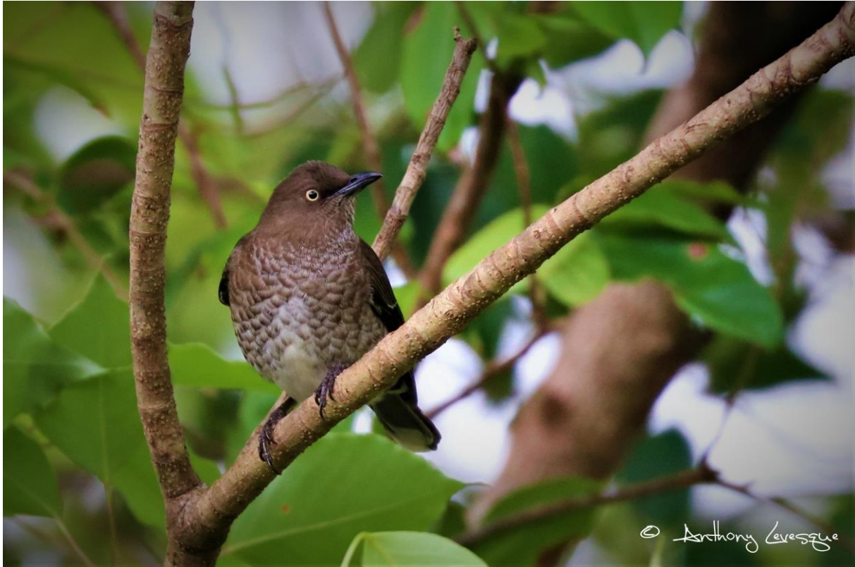
Le Moqueur grivotte a-t-il bénéficié de la diminution de la pression de chasse ?

Enfin, trois espèces chassables sont en augmentation : le Moqueur grivotte 48.32%, le Moqueur corossol 42.24% et la Tourterelle à queue carrée 34.56%. On peut éventuellement penser que les restrictions en matière de chasse des Moqueurs a porté ses fruits (diminution d'environ 45% de la pression de chasse en termes de nombre de jours chassables depuis quelques années).